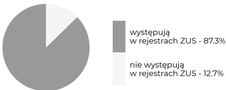
Absolwenci, którzy w okresie objętym badaniem ...