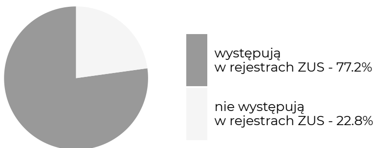
Absolwenci, którzy w okresie objętym badaniem ...