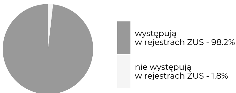
Absolwenci, którzy w okresie objętym badaniem ...